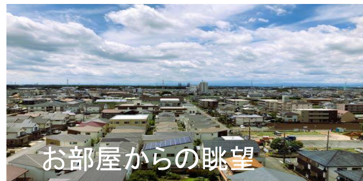
お部屋からの眺望